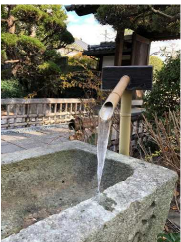
一月中頃はよく冷え込みました。

ところで、当山は、鐘楼も梵鐘もありませんので、（創建当時からないと思われる）当然除夜の鐘も撞きません。大晦日の晩に、釣り鐘（梵鐘）を百八回撞くならわしはいつ始まったのかわりませんが、梵鐘があるお寺では、毎年除夜の鐘を撞き、そのまま年越しで「除夜会（じょやえ）」を勤めるところもあるようです。うちは、一月一日午前九時から勤めます。