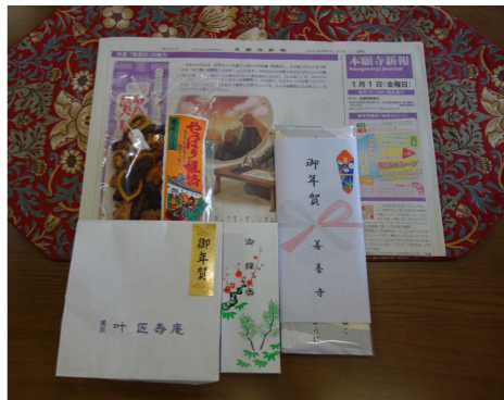
今年のお年玉 (ねんぎょく)